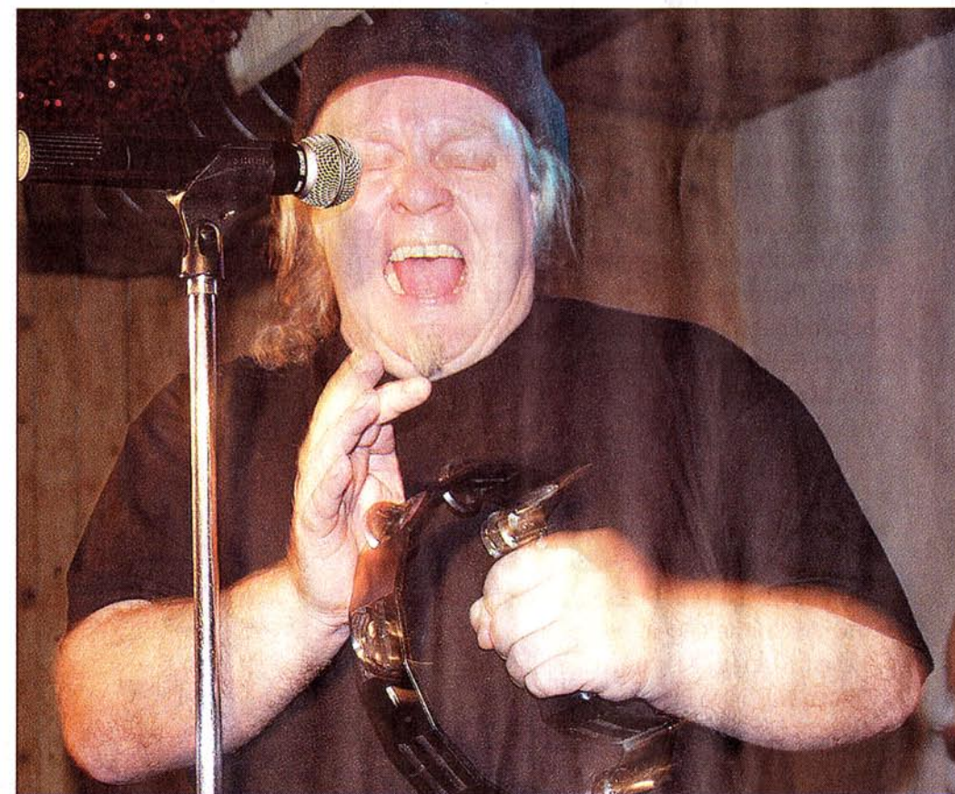
McCorkey: dynamisch und rasant.

PLAUEN – „Cool“, „geil“ und „super“ waren nur einige wertende Worte, die die zahlreichen Gäste des Premierenkonzertes von „GCG“ in der Ranch am Samstag von sich gaben. Denn es war ein Auftakt nach Maß, den Geffarth, McCorkey und Greek (GCG) im Saal zur Ranch-Rock-Saison 2004 vollzogen.